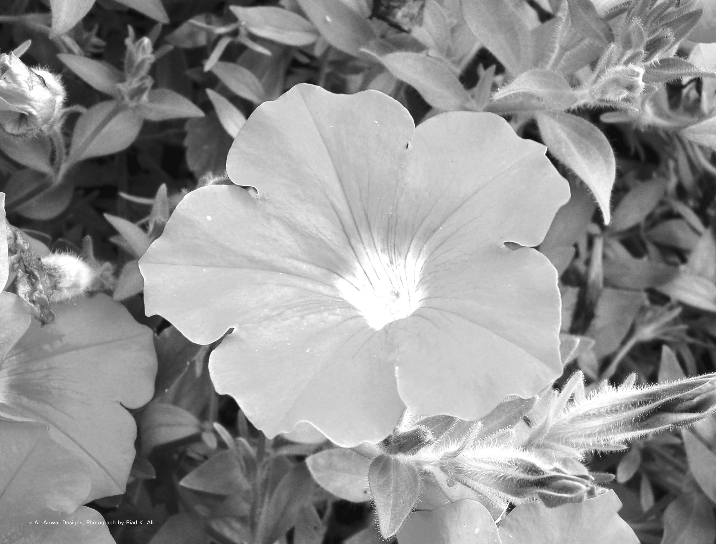
© AL-Anwar Designs, Photograph by Riad K. Ali